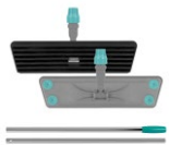
Lamello con mango